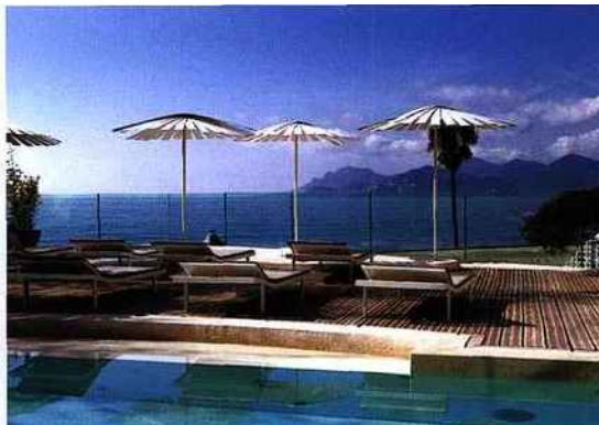
THERMES MARINS DE CANNES, RADISSON BLU