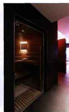
SPA CINQ MONDES, ROYAL ANTIBES