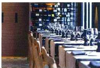
Une chambre de l'hôtel de Nell et le restaurant La Regalade, architecture d'intérieure Jean Michel Wilmotte